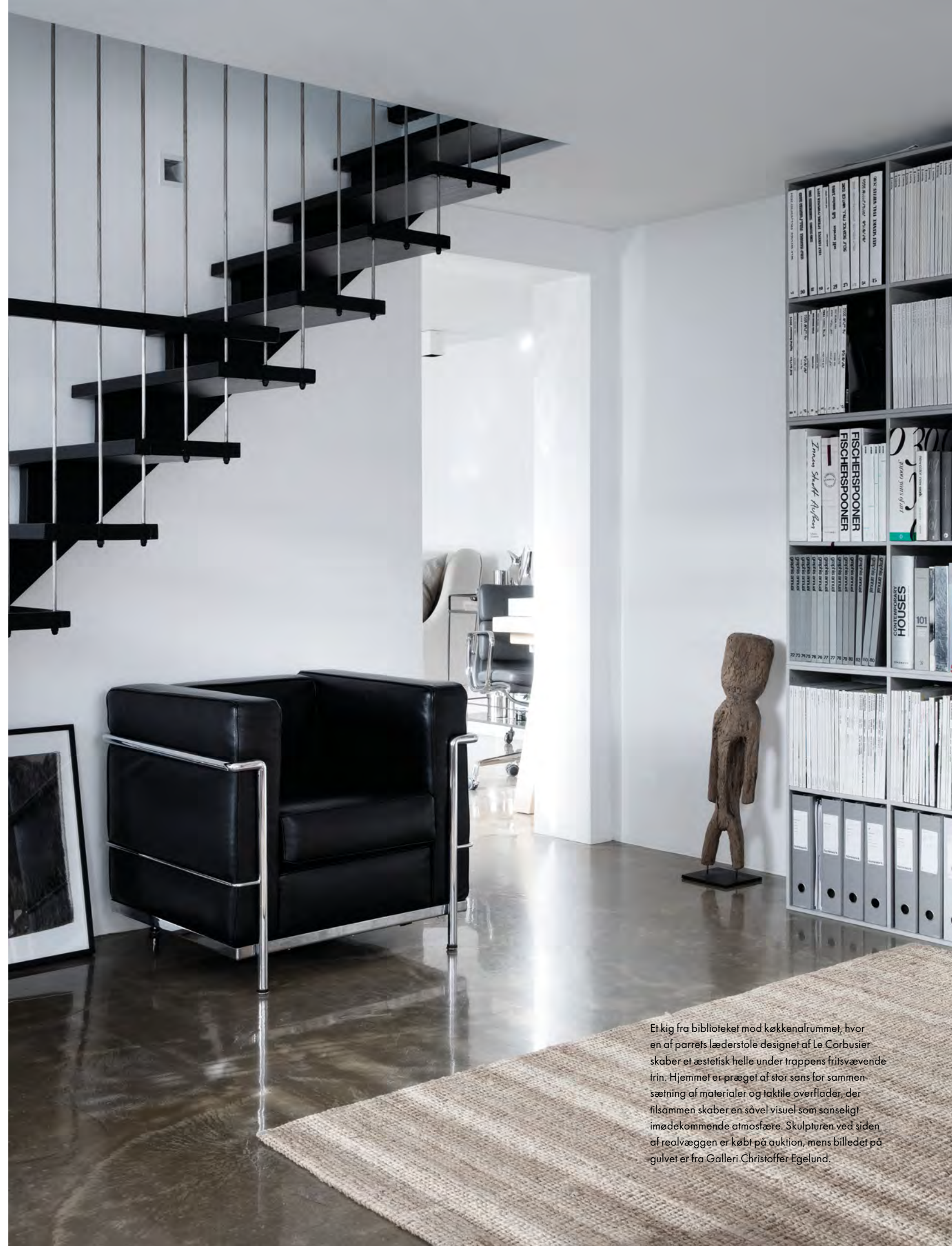
Et kig fra biblioteket mod køkkenrummet, hvor en af parrets læderstole designet af Le Corbusier skaber et æstetisk helle under trappens fritsvævende trin. Hjemmet er præget af stor sans for sammensætning af materialer og taktile overflader, der tilsammen skaber en såvel visuel som sanselig imødekommende atmosfære. Skulpturen ved siden af reolvæggen er købt på auktion, mens billedet på gulvet er fra Galleri Christoffer Egelund.

TEKST OG STYLING MILLE COLLIN FLAHERTY FOTO LINE THIT KLEIN