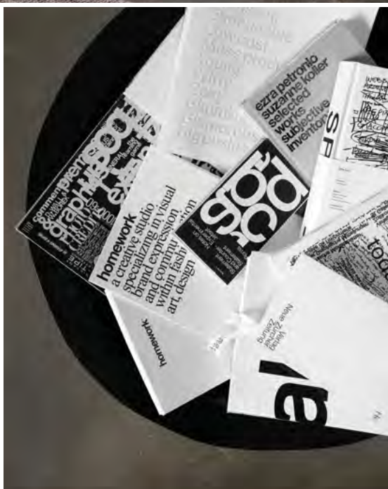
Det store fad på gulvet, der rummer publikationer i hvid og sort, er fra en af parrets rejser.

TEKST OG STYLING MILLE COLLIN FLAHERTY